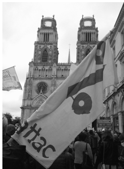
Drapeaux d'Attac lors de la manifestation du 21 sept.