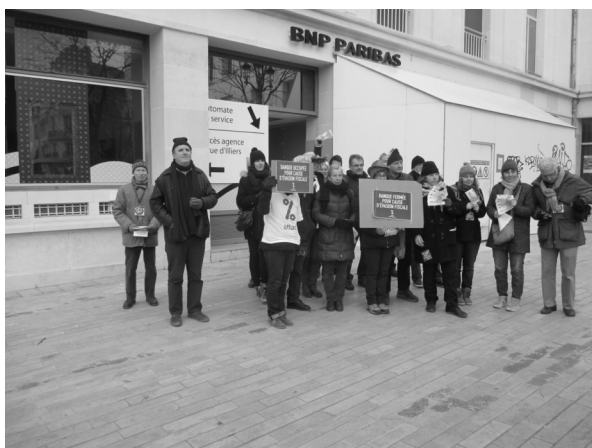
La joyeuse troupe devant la BNP Place du Martroi!