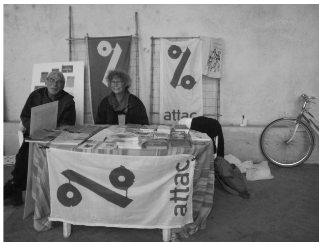
Stand d'Attac 45 à la Journée de Transition

Le samedi 16 septembre, a été organisée au campo Santo la Fête des Possibles/Village Alternatiba, le Village des alternatives au changement climatique et à la crise énergétique. Alternatiba constitue un village de transition vers le monde de demain. D'arcade en arcade, ont été présentées les réalisations et alternatives concrètes et locales (agriculture paysanne et durable, jardins partagés, incroyables comestibles, écoconstruction, économies d'énergie, systèmes Zéro déchets, Villes en transition, déplacements doux, banques éthiques, recyclage...) permettant dès aujourd'hui à chacun de lutter concrètement contre le changement climatique en cours. Plus de 1000 personnes ont échangé avec les 160 exposants, dont faisait partie Attac 45 comme l'illustre la photo ci-contre!